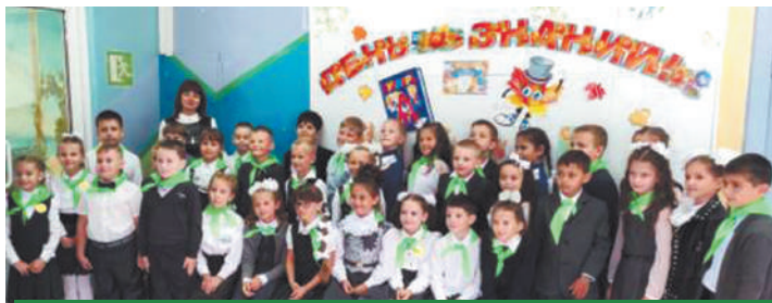
Эколята из 2 «Б» класса.